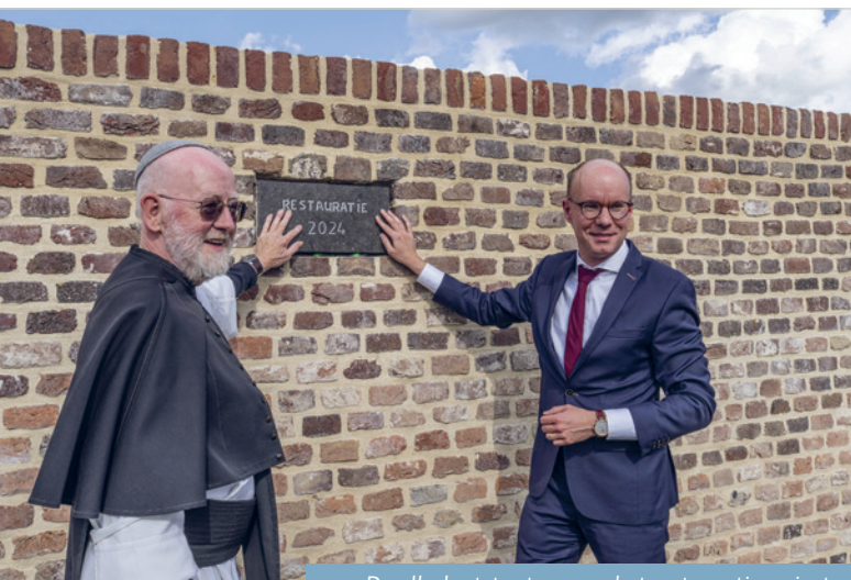
De allerlaatste steen van het restauratieproject