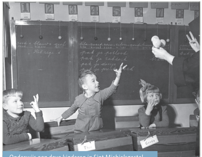
Onderwijs aan dove kinderen in Sint Michielsgestel

Voor Brabanders en andere geïnteresseerden in de geschiedenis van deze provincie biedt www.brabantinbeelden.nl een schat aan bijzondere historische — en wellicht herkenbare — beelden. Het Erfgoedcentrum leverde voor dit samenwerkings-