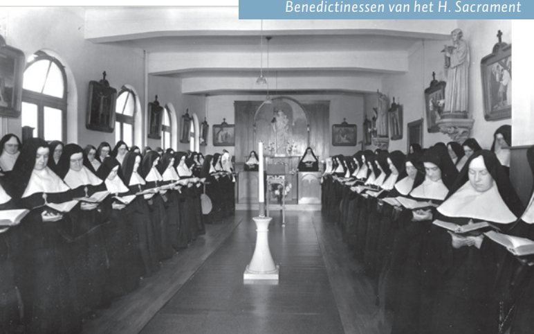
Benedictinessen van het H. Sacrament