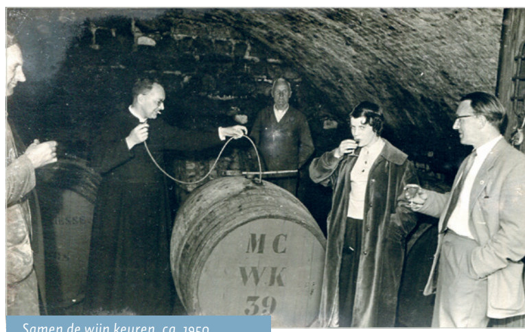
Samen de wijn keuren, ca. 1950