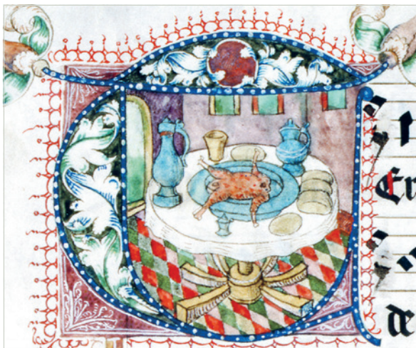
Miniaturen bij de gezangen voor het feest van de Kerkwijding